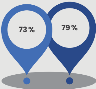
Grands centres urbains

« Maintenir des contenus scientifiques de qualité qui permettent de comprendre les connaissances scientifiques qui sous-tendent les enjeux contemporains »